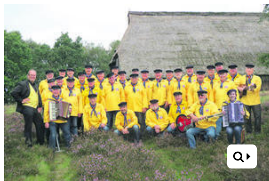
Der Heidjer Shantychor trägt maritime Lieder vor

ah. Holm-Seppensen. Maritim wird es am Samstag, 22. April, im Kulturbahnhof (Bahnhofsweg 4) in Holm-Seppensen. Ab 19.30 Uhr tritt der Heidjer Shantychor aus Buchholz dort auf und trägt Lieder von Küste, Seefahrt und Meer vor. Um Reservierung wird unter Tel. 04187-900771 gebeten, da das Platzangebot begrenzt ist. Passend zum Thema "Lieder von der Waderkant" werden Fischbrötchen und Getränke gereicht. Der Eintritt kostet acht Euro, Vereinsmitglieder zahlen sechs Euro. Infos: www.kubahose.de